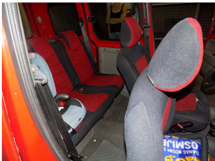
3. RENAULT KANGOO - unutrašnjost vozila