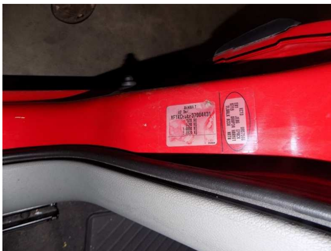
2. RENAULT KANGOO – broj šasijske