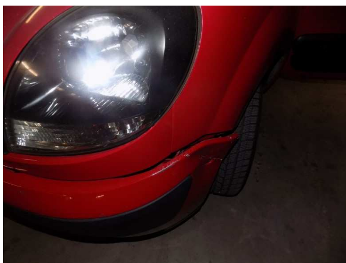
4. RENAULT KANGOO – oštećenje branika