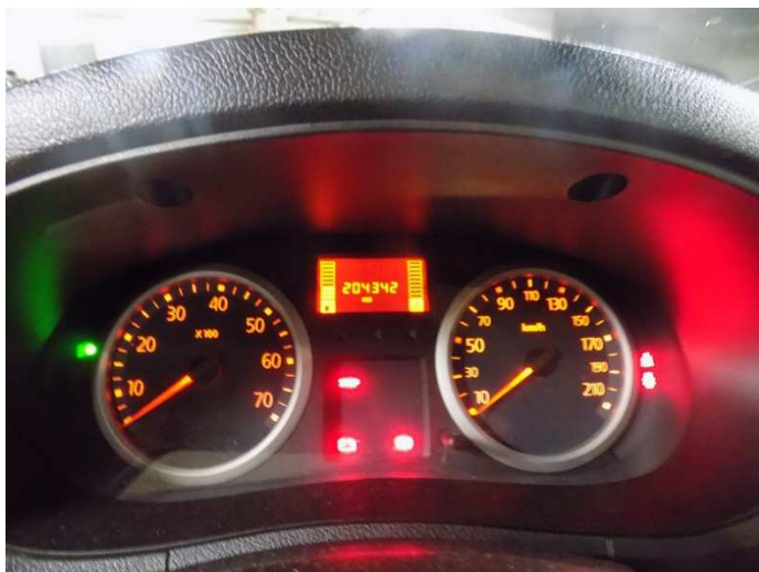
1. RENAULT KANGOO kilometar sat