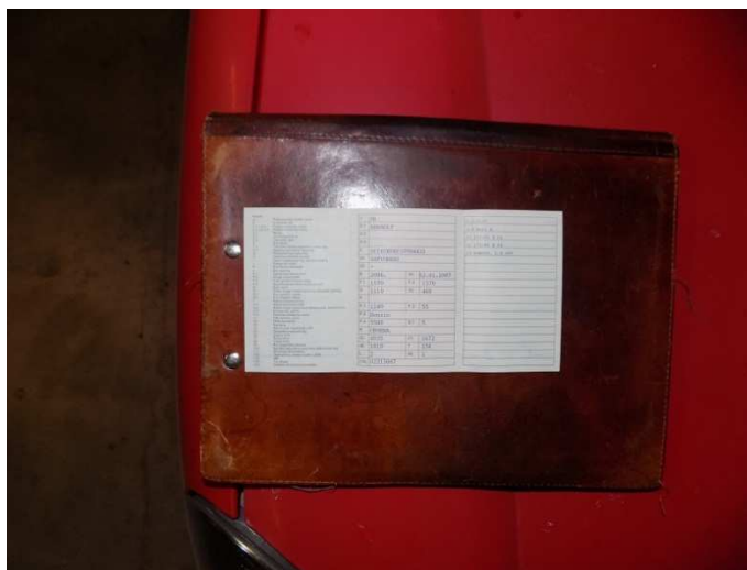
6. RENAULT KANGOO – prometna dozvola