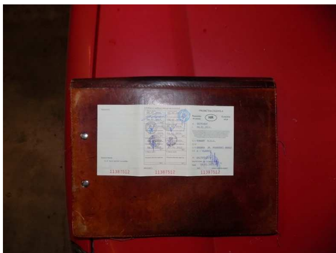
5. RENAULT KANGOO – prometna dozvola